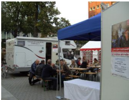
Beratung u. Betreuung auf dem Averdunk-Platz

Aktion „Gegen Armut und soziale Ausgrenzung“. Der Verein hat sich an der vom Diakoniewerk initiierten Aktion im September 2010 beteiligt. Das Wohnmobil verlagerte seine Betreuungsarbeit für 2 Tage zum Averdunkcenter. Betroffene wurden beraten und betreut, aber auch der interessierten Bevölkerung standen wir Rede und Antwort.