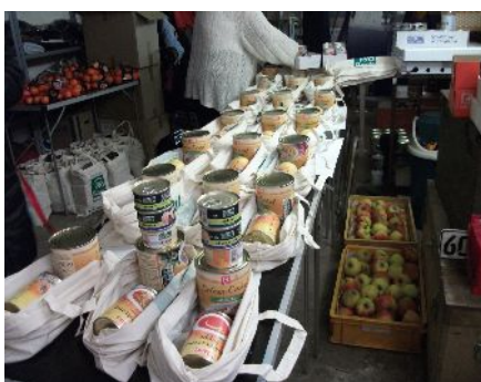
Mitarbeiter beim Packen der Winterbeutel

Die Tradition, dass wir zur Weihnachtszeit für unsere Betreuten ein kleines Weihnachtsgeschenk in Form eines Winterbeutels, gefüllt mit einigen weihnachtlichen Leckereien und einigen praktischen Gegenständen des täglichen Bedarfs, zusammenstellen, haben wir auch im Berichtsjahr fortgesetzt. Insgesamt sind ca. 150 Winterbeutel verteilt worden. Die PSD-Bank Rhein-Ruhr hat uns zu diesem Zweck finanziell unterstützt. Dafür danken wir recht herzlich.