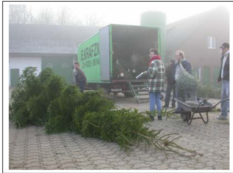
Beim Einladen und kontrollieren der Bäume